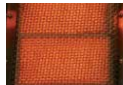
Brûleurs de cuve infrarouges (modèles LEX605 et LEX730)