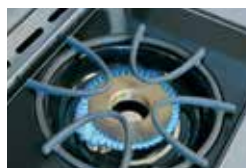
Brûleur latéral de cuisinière (modèle LEX485)