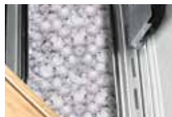
Bac à glace/marinades et planche à découper intégrés (modèle LEX485 exclu)