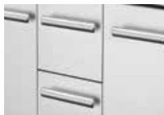
Tiroirs centraux EASY SLIDE™ (modèle LEX730)