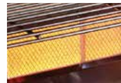
Brûleur arrière infrarouge en céramique