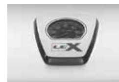
Jauge de température ACCU-PROBE™