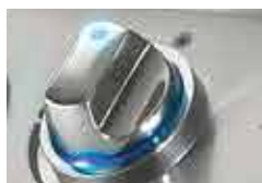
Technologie rétroéclairée i-GLOW™