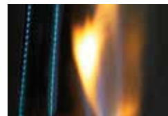
Système d'allumage JETFIRE™