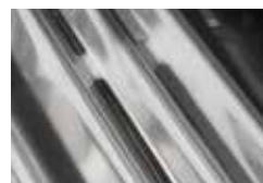
Plaques de brûleur en acier inoxydable