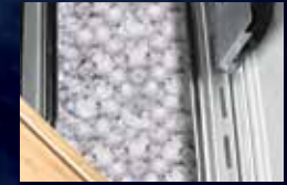
Bac à glace / marinades et planche à découper intégrés (modèle LEX485 exclu)