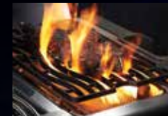
Brûleur latéral infrarouge SIZZLE ZONE ™ (LEX485RSIB)