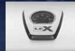
Jauge de température ACCU-PROBE ™