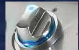
Technologie rétroéclairée i-GLOW ™