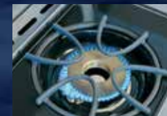
Brûleur latéral de cuisinière (LEX605 et LEX730)