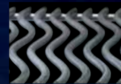
Grilles de cuisson WAVE ™ emblématiques en acier inoxydable