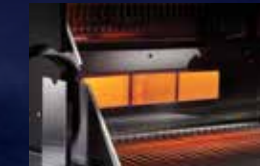
Brûleur arrière infrarouge en céramique (modèle LEX485 exclu)