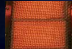
Brûleurs de cuve infrarouges (LEX605 et LEX730)