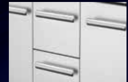
Tiroirs centraux EASY SLIDE ™ (LEX730)