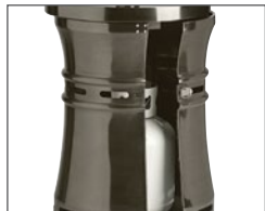
Porte d'accès au réservoir de propane

40 000 BTU Surface chauffée : 20' dia. Propane 90" H x 33 1/2" L