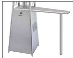
Tablette latérale/table de bar optionnelle