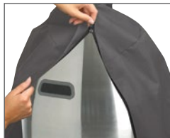
Housse robuste optionnelle