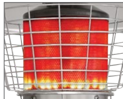
Brûleur robuste à haut rendement