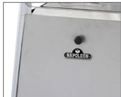
Porte d'accès au réservoir de propane

Le Flambeau pleine vision Bellagio™ de Napoléon® procure un éclairage d'ambiance relaxant depuis une seule flamme attrayante et lumineuse de quatre pieds. Sa conception unique comprenant un grillage de sécurité SAFEGUARD™ et une vue de la flamme sur 360° répond aux demandes de style de vie moderne et constitue un ajout parfait aux piscines, aux patios et aux pièces extérieures. Cet amalgame inspirant entre l'art et le design saura animer votre espace de séjour extérieur. Un ensemble de conversion optionnel pour le gaz naturel est également disponible.