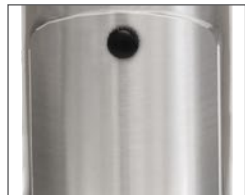
Porte d'accès pratique