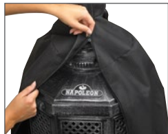
Housse robuste optionnelle

Si vous êtes à la recherche d'un style classique et raffiné, le chauffe-patio de la série en fonte d'aluminium est le complément parfait à votre espace de séjour extérieur. Sa structure en fonte d'aluminium assure solidité et durabilité tandis que le style ornemental en fini étain saura ajouter une touche d'élégance et de finesse. La chaleur irradiant sur 20' de diamètre vous procure une source de chauffage efficace pour votre espace de séjour extérieur, vous permettant ainsi de recevoir vos invités en tout confort. Il est muni d'un allumeur électronique et d'un contrôle ajustable de la chaleur. Ce modèle au propane comprend un compartiment de rangement décoratif pour le réservoir.