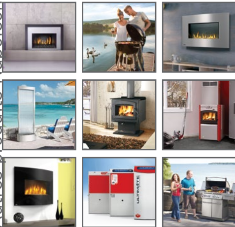
Foyers encastrés • Grills au charbon de bois • Foyers au gaz • Cascades d'eau • Poêles à bois Fournaises hybrides • Foyers électriques • Chauffage et climatisation • Grills à gaz de qualité