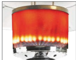
Brûleur robuste à haut rendement

Doté d'une base solide ainsi que d'un style raffiné et élancé, ce modèle au gaz naturel de la série en fonte d'aluminium occupe peu d'espace dans votre aire de séjour extérieur. La finesse des détails en fait un élément de décor remarquable, et sa structure en fonte d'aluminium est un gage de qualité. La chaleur irradiant sur 20' de diamètre vous procure une source de chauffage efficace pour votre espace de séjour extérieur.