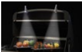
Lumière de poignée universelle double 70020/70021