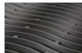
Grilles de cuisson vaguées en fonte