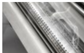
Pipe à boucane 67011