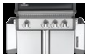
Tablettes latérales rabattables