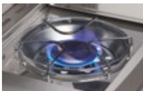
Brûleur latéral de cuisinière