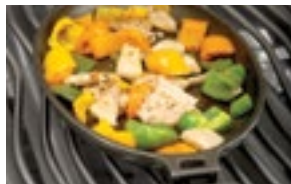
Poêle à frir en fonte 56003