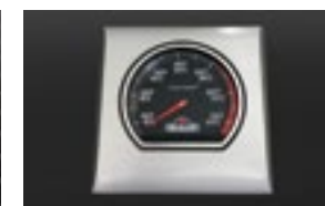
Jauge de température ACCU-PROBE MD