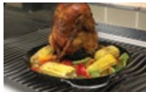
Wok et rôtissoire à poulet 2 en 1 56020