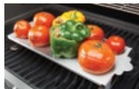
Support de cuisson pour piments et tomates 56028/56029