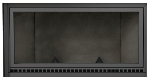
Panneaux de briques décoratifs lisses